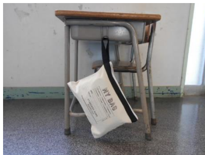
< D : 取って付きポーチ >

ぎりぎり床につかない状況です。 取って部分が10cmより長かったり、 伸びたりすると床についてしまいます。