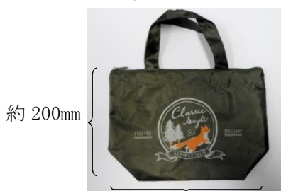
<B：ファスナー付トート>