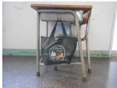
<B：ファスナー付トート>