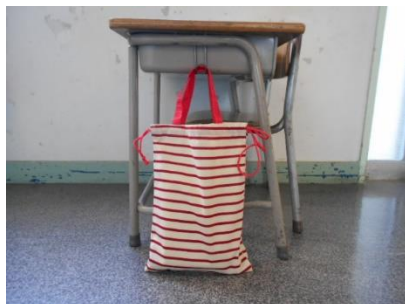
< C : バッグきんちゃく >