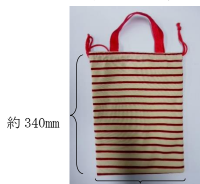
<C：バッグきんちゃく★>