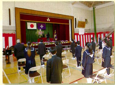
入学式 始業式・着任式 生徒総会