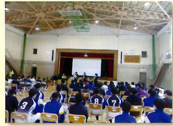
新入生オリエンテーション