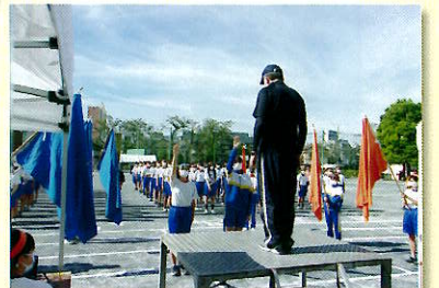
始業式 生徒会選挙 運動会