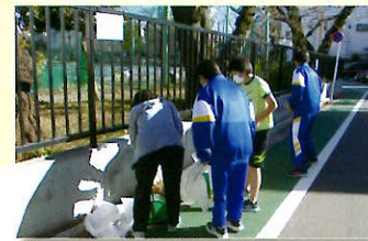
クリーンボランティア(7年)