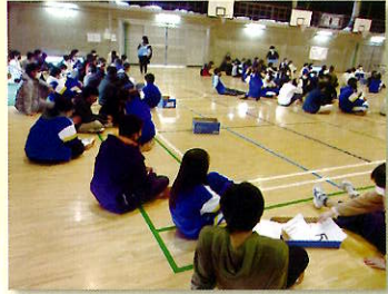
巣立ちの会 卒業式 修了式