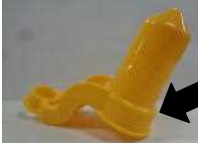
この辺にクラスと名前

また、ペットボトルの口につける「じょうろ」の部分も持ち帰りました。ペットボトルと同様に、クラスと名前(ひらがな)を書いて、ペットボトルに付けて持たせてください。