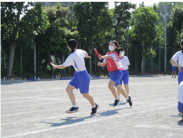
全級リレー（バトンプスミスなし！さすがです）