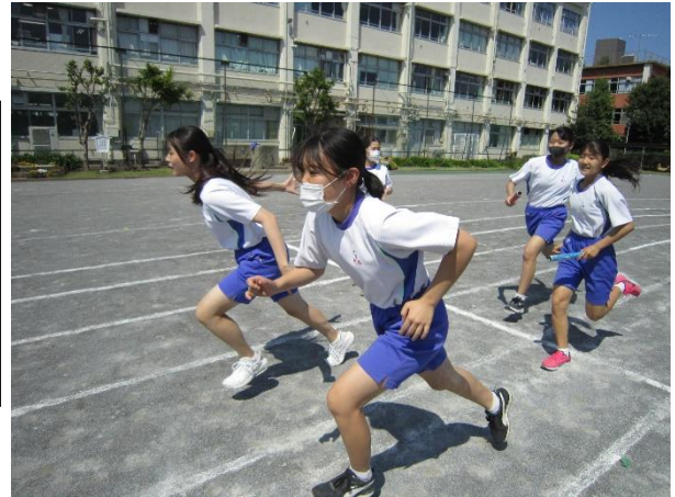
学級対抗リレーバトンプスの様子