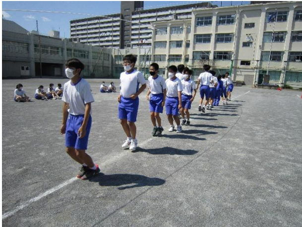
大縄跳びの練習の様子

2年間、縮小した形で運動会を行ってきましたが、今年は体育祭として開催いたします。高島第二中学校の体育祭がどのようなものか手探りの中、多くの生徒が練習や準備を協力的に取り組みました。先輩から受け継いできたバトンを、今度は後輩に渡せるように、当日も一生懸命取り組む格好良い姿を見せてほしいです。（写真は学年練習の様子）