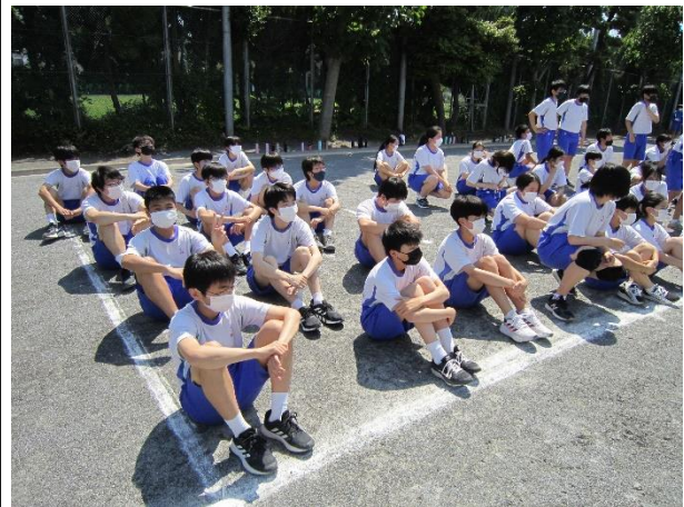
応援席で集合している様子