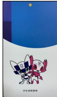
学校観戦チケット

東京都内の新型コロナウイルス感染症陽性者の数が再び上昇する日々になってしまいました。東京2020大会では学校観戦中止、また、東京を始めとした多くの自治体で無観客での開催となりました。幻のチケットを片手に、テレビで静かに観戦しようと思います。