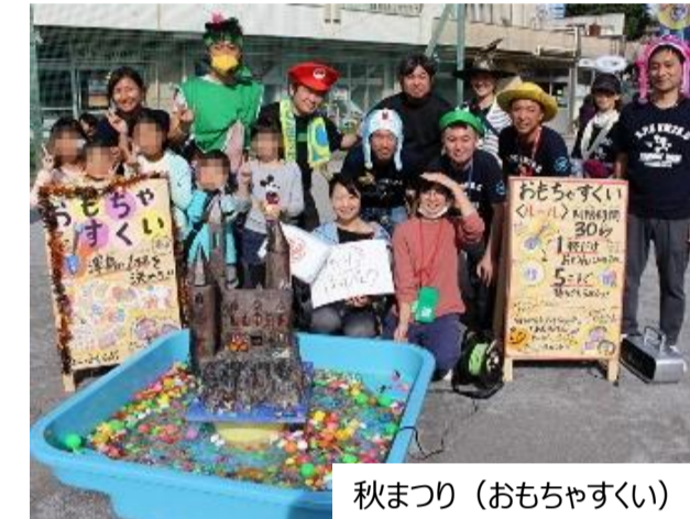
秋まつり (おもちゃすくい)

小さい頃から工作が大好きで、「秋まつり」でお城のオブジェを製作したり、とてもワクワクしながら作業しました。下の子がまだ小さく、習い事もあるためフル参加は難しいのですが、出来る事を見つけて活動を楽しんでいます。(在校生・母)