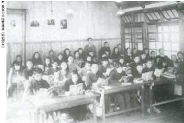
《教室での授業風景 昭和27年》

待望の5月1日、この日は素晴らしいお天気であった。午前10時半に開校式と入学式が開始された。本校は、区内唯一の独立校舎として羨望の的であったが、実際に開校してみると、教室が8室、武道場は志村署へ貸されて使用不可。他の建物は全て東京光学の工場で、運動場の使用も自由にできず、全く閉口した。