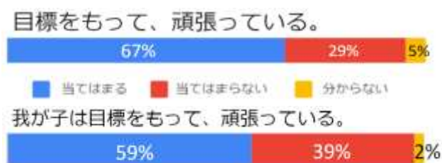
令和5年度 学校評価アンケートの結果より