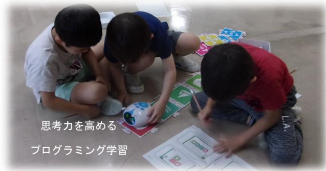
思考力を高める プログラミング学習