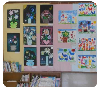
本と児童の作品がいたる所に