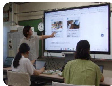
ITC 活用の教員研修会