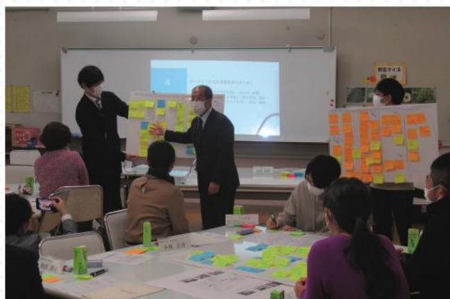
■各グループの意見交換後には発表を行っていただきました。