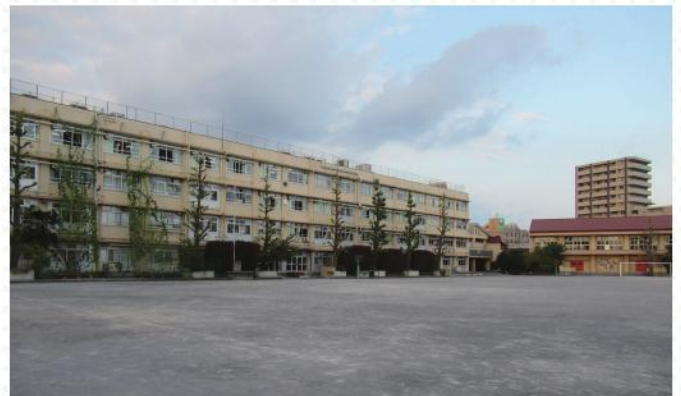
■グラウンドから見た現校舎