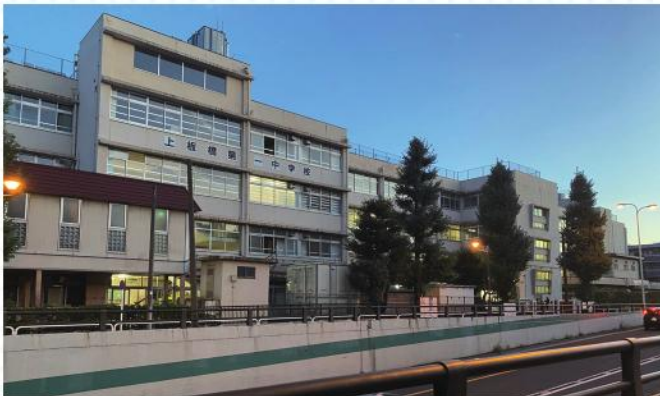
■環状七号線側から見た現校舎

令和2年度には、「改築工事中の仮校舎運営のお知らせ」、「上板橋第一中学校改築アンケート」を実施し、令和3年10月には「上板橋第一中学校改築検討会」が設置されました。