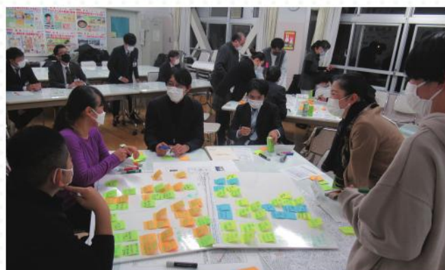
■意見交換では、様々なアイデアを出していただきました。