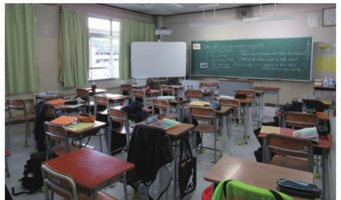
■現校舎の普通教室