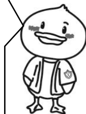
Kaga junior high school 60th Anniversary

運動会に向けての練習が続いています。熱中症予防対策をとりながら、慎重に練習を進めていますが、各ご家庭におかれましても、睡眠や休養・栄養を十分にとり、体調を整えて練習に参加するよう、ご協力をお願いします。「挑・合・創」をキーワードに、令和時代の加賀中運動会をみんなで創りましょう。加賀中 Fight!