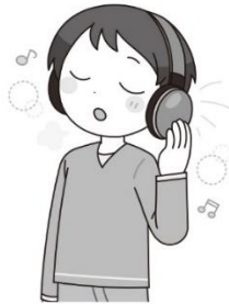
好きな音楽を聞く