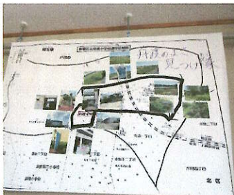
総合的な学習の時間「舟渡のよさ見つけ隊(3年)」より