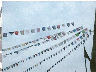
運動会の万国旗に替わって 子どもたち手作りの旗