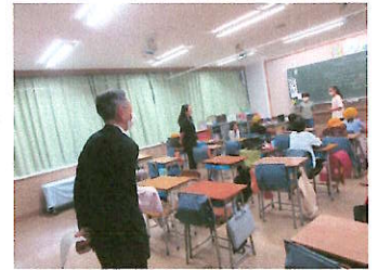
5・6年生の児童(委員会活動)と コミュニティ・スクール委員会のメン ンバーで舟渡小がさらによくなる ように話し合いました！