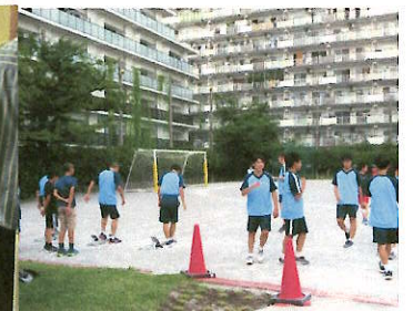
学びのエリア・志村第五中学校との交流(運動会ボランティア、生徒会によるあいさつ運動、部活動体験)