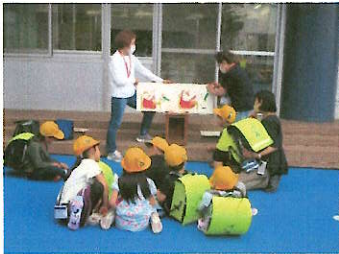
朝の校庭遊びに加え、読み聞かせも始めました。 正門では、あいさつ運動も実施しています！

令和5年度1学期も保護者や地域、学びのエリア「志村第五中学校」の皆様のご協力のおかげで1つ1つが舟渡小学校の“実”となりました。ご協力、ありがとうございました。そして、2学期以降もご支援・ご協力の程、どうぞよろしくお願いいたします。