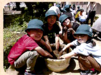
花蓮植えかえ体験