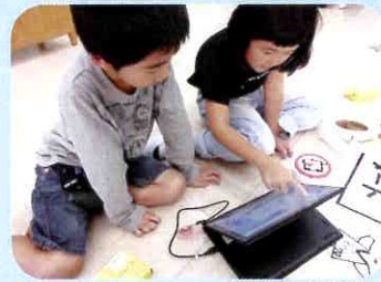
GIGA スクール端末の活用 (プログラミング教育)