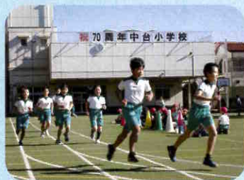
持久走チャレンジ