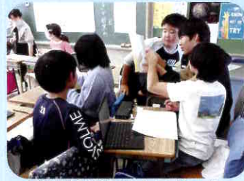
板橋区授業スタンダード (主体的・対話的学び)