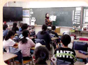
保護者ボランティアによるよみきかせ(よみっこ)