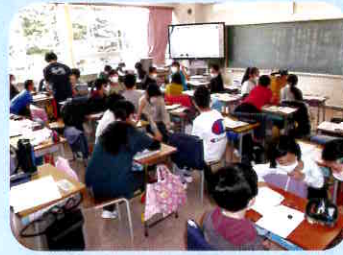
読み解く力の育成