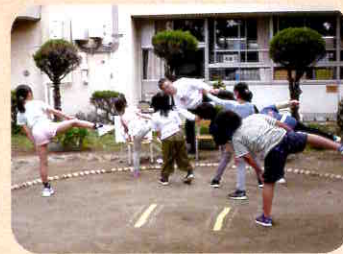
土壌を活用した活動