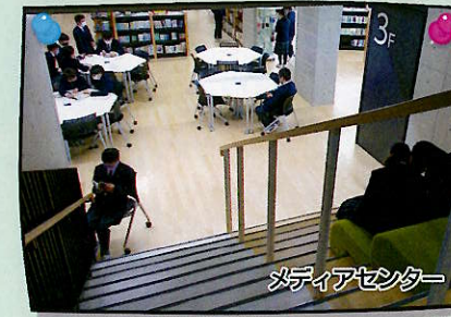
メディアセンター