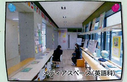
メディアスペース(英語科)