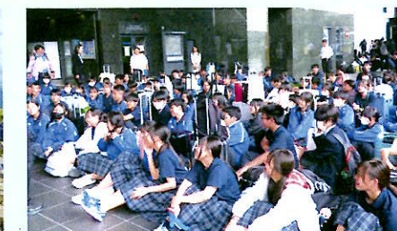
関西方面 修学旅行(9年)