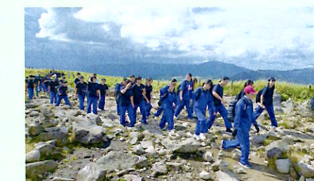
富士見高原 移動教室(8年)