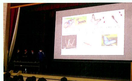
探究学習(校外学習8年)