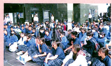
関西方面 修学旅行(9年)