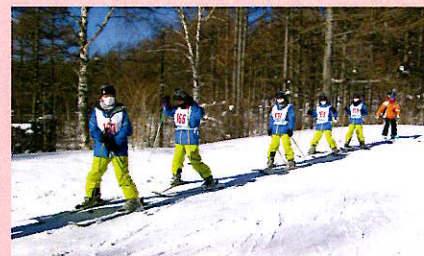
湯の丸高原 スキー教室(7年)