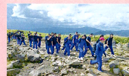
富士見高原 移動教室(8年)