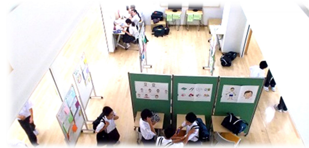
さくら草学びのエリア(中台小学校・若木小学校)で小中一貫教育に取り組みます。

校訓 よく考えて判断し、責任ある行動のもとに 互いにはげましあって 心と体をきたえよう