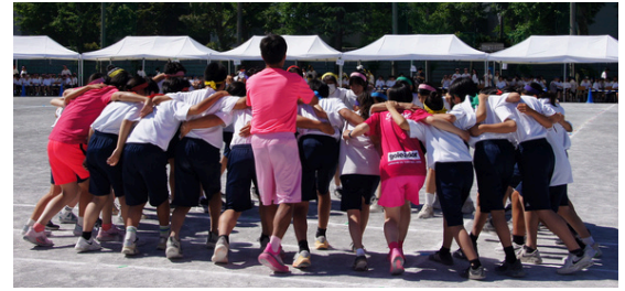
各チームが円陣を組みかけ声をかける姿 中でも実行委員の絆は熱い

5月25日から運動会当日まで、今年度も生徒会本部の企画で盲導犬募金を実施しました。多くの皆さんの応援をいただき、