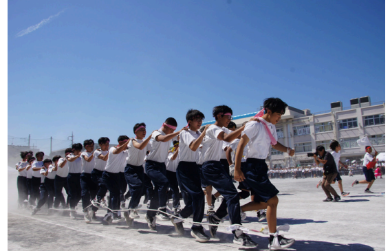
大迫力の9年生大百足リレーは、最終ゴールまで大声援が響く

5月最終日に開催された運動会は、全校生徒の流した汗と涙が光る中、大きな感動とともに幕を閉じました。嬉しさも悔しさも、最後には一緒につくりあげた仲間との大切な思い出になったことでしょう。実行委員会を中心に声をかけ合い、生徒全員が一直線に勝利に向かって走り抜けた、まさに青春の1ページでした。9年生の勇姿を心に刻み、西台中の伝統はしっかりと後輩たちに引き継がれました。