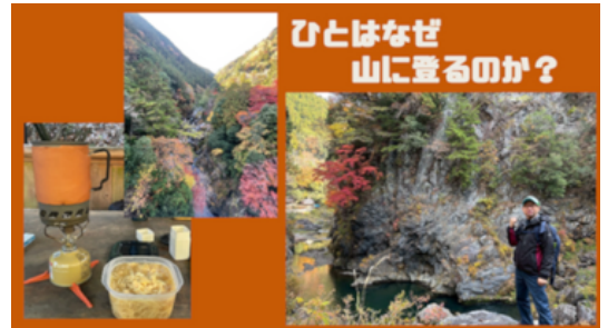
奥多摩の鳩ノ巣渓谷を歩きました。紅葉が良かったです。自然の中の自炊が最高(*^v^*)

そこで今回は「あえて、面倒なことをしていることについて教えてください。」と皆さんに投げかけました。