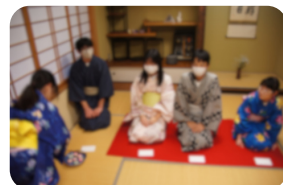
↑家庭科部、茶道部、日本文化研究部のコラボ企画 和装でお手前 講師の先生をお招きして茶室にて

令和7年度 身近な環境に関する標語展 佳作「他人任せだといつかなくなる 自然と地球」（