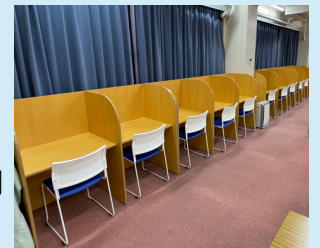
西台中同窓会から寄贈された自習机です