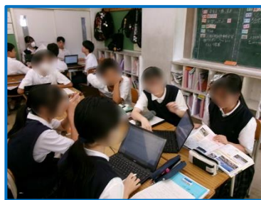
タブレットを活用した授業