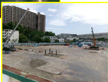
R7から校庭工事中・・・