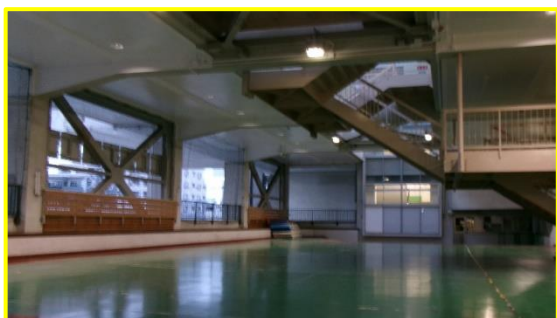
授業等で活用中のマルチパーパス