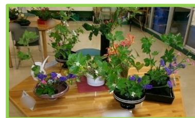
花のある職員室前（華道部）