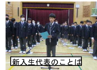
新入生代表のことは