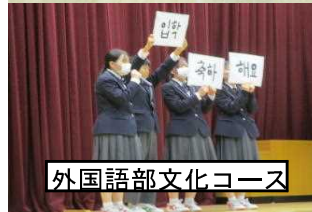
外国語部文化コース