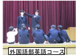
外国語部英語コース