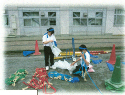
実行委員、係の生徒たちが本当によく頑張りました。