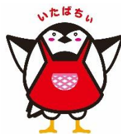
板橋区食育キャラクター

新学期が始まってからひと月がたち、疲れが出やすい頃です。手洗い、うがいをしっかりと行い、栄養バランスのよい食事と十分な睡眠、そして適度な運動を心がけましょう。生活リズムを整えて、体の抵抗力を高めておくことが大切です。