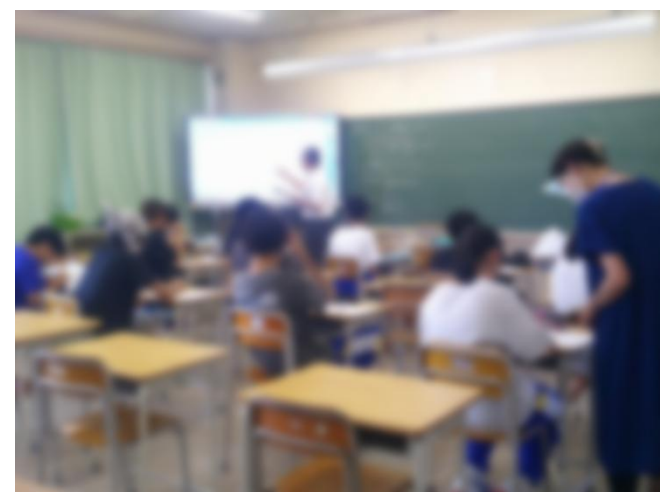
B組 数学(基礎クラス)