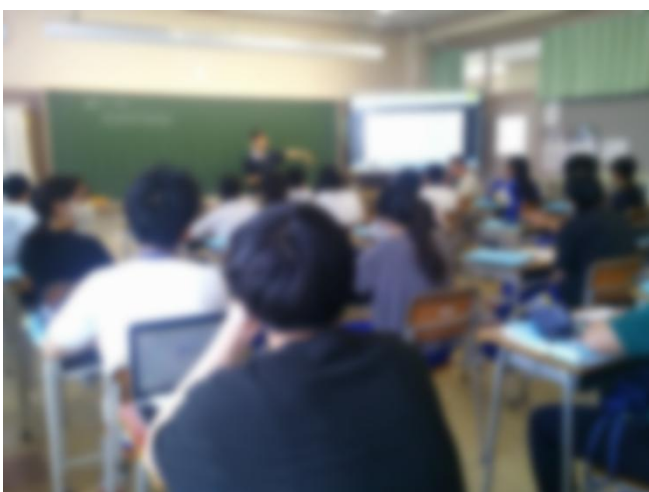
B組 数学(発展クラス)