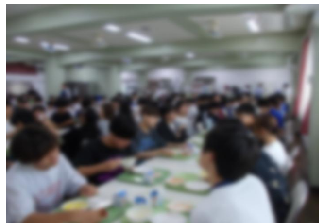
今週の給食の様子