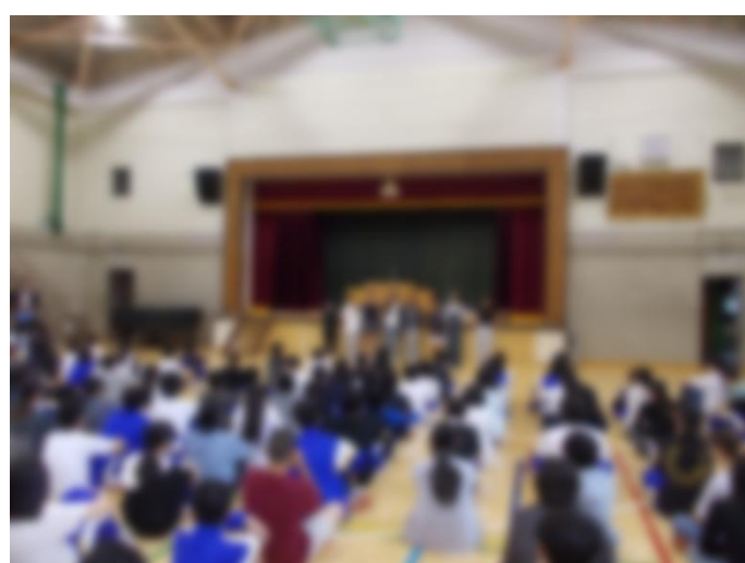
ソフトテニス部女子・団体 都大会出場権獲得の報告