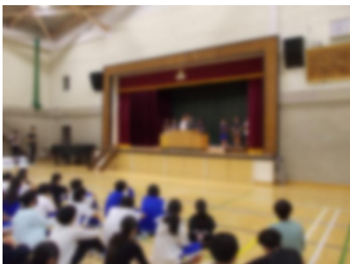
学級委員より クラス目標の発表