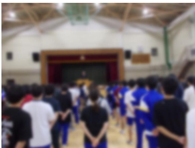
全校朝会 校長先生のお話（15日）