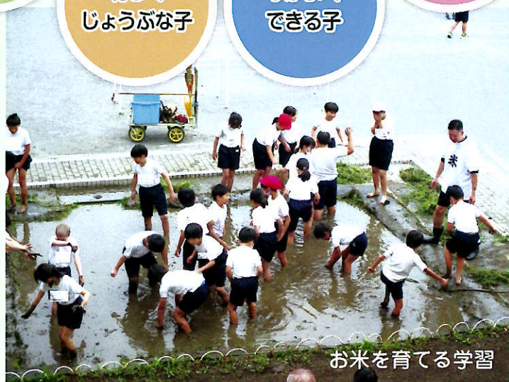
お米を育てる学習