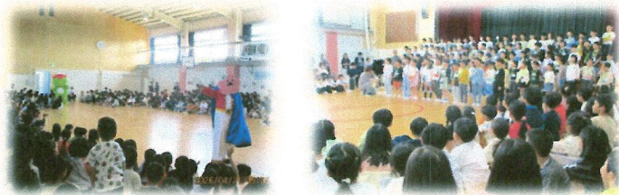
紅梅マンとかばまるも「1年生を迎える会」を盛り上げてくれました。

○ユネスコの任務である教育・文化・科学・コミュニケーションの分野における平和のための国際協力に資する「アイデアの実験室」として、組織や人材の能力開発と政策やモデルの構築に貢献するために、国際間・地域間協力を進めること。など