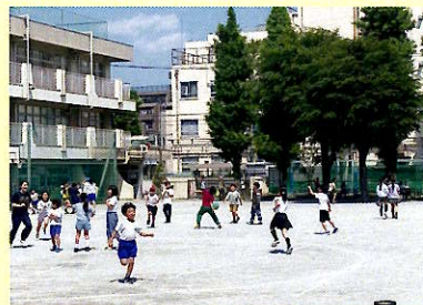
中休み(全校外遊びの励行)