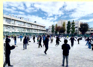
年4回の体力向上週間