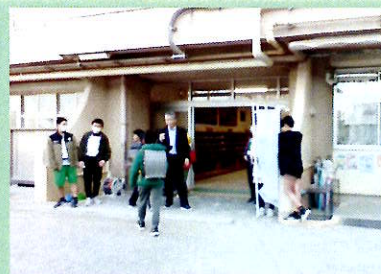
毎月のあいさつ週間