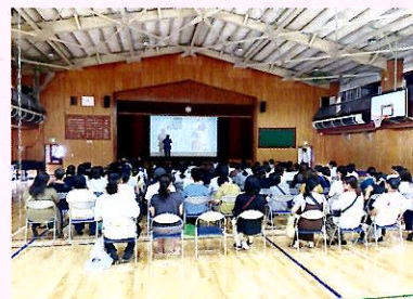
道徳授業地区公開講座