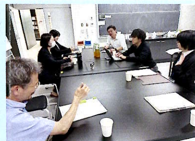
学びのエリア研修会