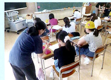
ひるスタ(補習教室)