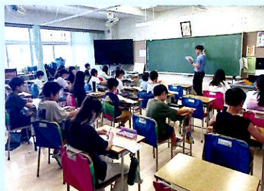
基礎タイム(漢字習得学習)