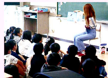
「上二っ子応援団!」による保護者読み聞かせ