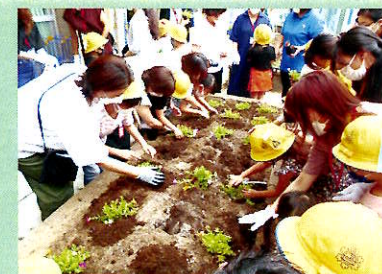
CS委企画「親子での花育プロジェクト」