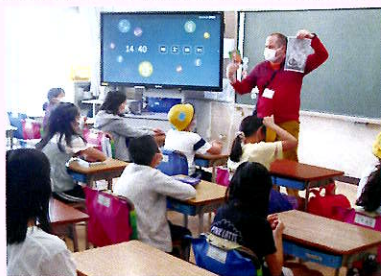
委員会・クラブ活動ボランティア