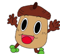
140周年 マスコットキャラクター 「マテくりん」