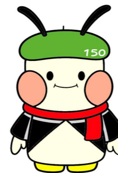
150周年 マスコットキャラクター 「いちご丸」