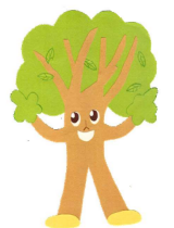
130周年 マスコットキャラクター 「マッティー」

〒174-0073 東京都板橋区東山町47-3 Tel 03-3972-1661 Fax 03-5995-8345 特別支援(知的) Tel 03-3972-1784 特別支援(聴覚言語) Tel 03-3972-1663 https://www.ita.ed.jp/ 1310279