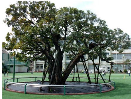
学校のシンボル まてばしい

上板橋小学校は、今年創立150年目を迎える長い歴史のある学校です。4月1日現在の児童数は231名の小規模校です。学校には、通常の学級の他に、特別支援学級（知的）と難聴言語学級（きこえとことばの教室）があり、多様な子どもたちが共に学んでいます。通常の学級と特別支援学級の子どもたちは、委員会活動やクラブ活動、異学年交流であるたてわり班活動や学校行事等を通して共同学習や交流活動を計画的に行っています。