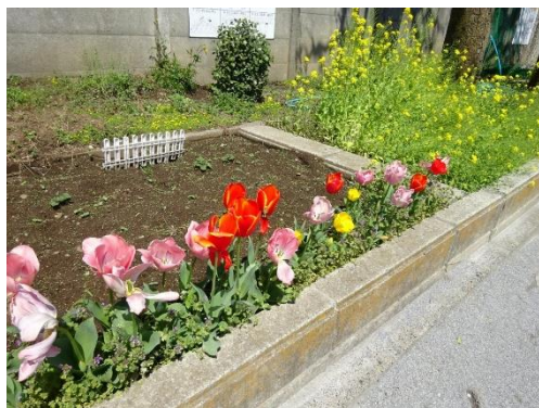
チューリップとともに咲く校庭の菜の花