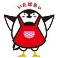
板橋区食育キャラクター