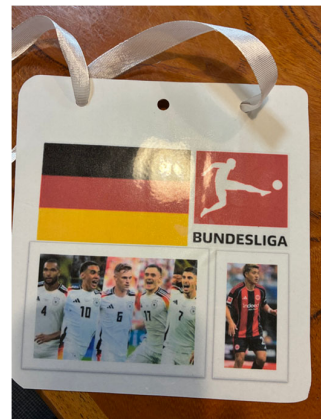
会議後に作成された試作プレート