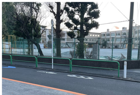
マーク整備前→→→→→→→自転車ナビマーク整備後