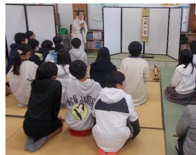
地域との連携 (伝統文化 茶道体験)