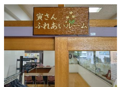
寅さんふれあいルーム （卒業生を偲んで）