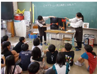
清水図書館による読み聞かせ （地域と連携した読書活動）