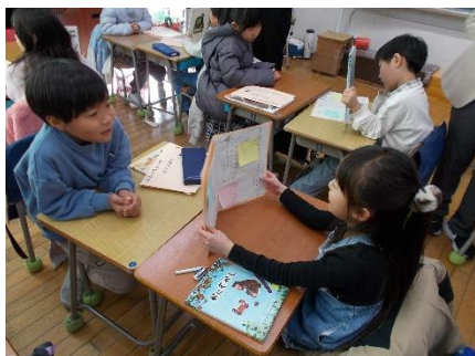
学ぶ喜びを実感できる 「個別最適×協働」型の授業