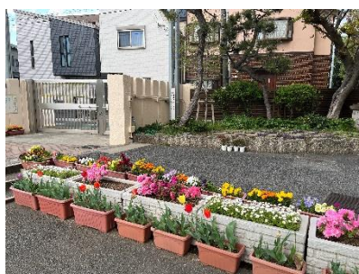
花があふれる学校 （グリーンボランティアによる環境整備）