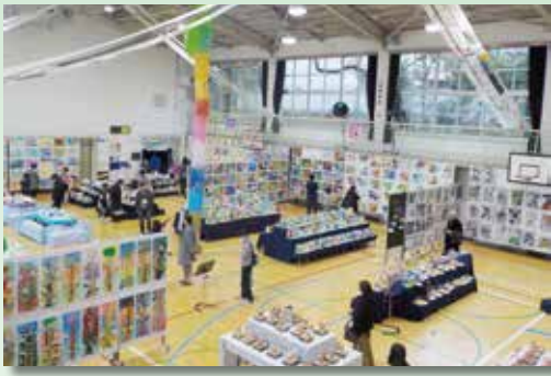
展覧会 (音楽会と隔年開催)